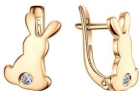
СЕРЬГИ РОЗОВОЕ ЗОЛОТО 47 960 Р