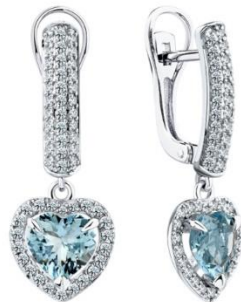
СЕРЬГИ БЕЛОЕ ЗОЛОТО, АКВАМАРИНЫ, БРИЛЛИАНТЫ 713 840 Р