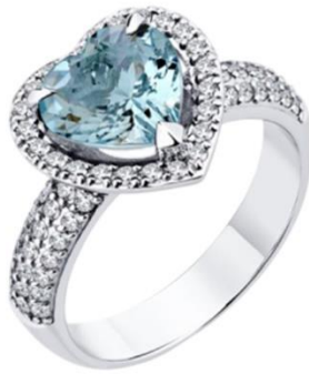
КОЛЬЦО БЕЛОЕ ЗОЛОТО, АКВАМАРИНЫ, БРИЛЛИАНТЫ 476 960 Р