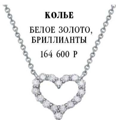
БЕЛОЕ ЗОЛОТО, БРИЛЛИАНТЫ 164 600 Р