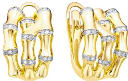
СЕРЬГИ ЖЕЛТОЕ ЗОЛОТО, БРИЛЛИАНТЫ 305 050 Р