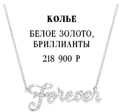
КОЛЬЕ БЕЛОЕ ЗОЛОТО, БРИЛЛИАНТЫ 218 900 Р