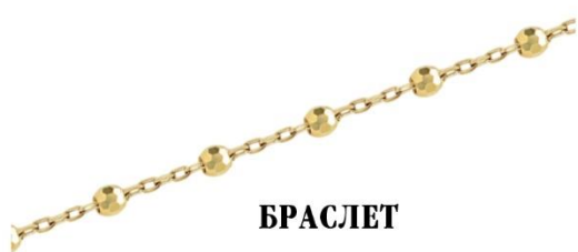
БРАСЛЕТ ЖЕЛТОЕ ЗОЛОТО 32 430 Р