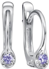
СЕРЬГИ БЕЛОЕ ЗОЛОТО, ТАНЗАНИТЫ 20 610 Р