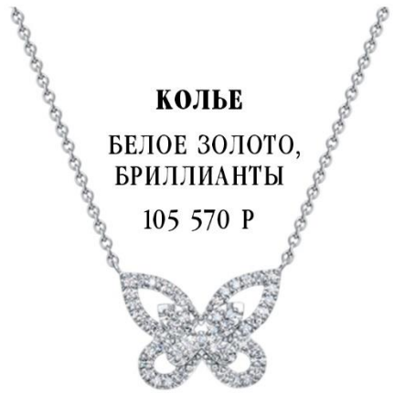
КОЛЬЕ БЕЛОЕ ЗОЛОТО, БРИЛЛИАНТЫ 105 570 Р