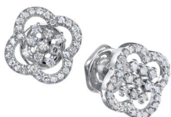
СЕРЬГИ БЕЛОЕ ЗОЛОТО, БРИЛЛИАНТЫ 87 460 Р