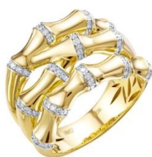
КОЛЬЦО ЖЕЛТОЕ ЗОЛОТО, БРИЛЛИАНТЫ 244 950 Р