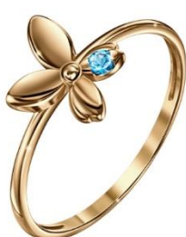
КОЛЬЦО РОЗОВОЕ ЗОЛОТО, ФИАНИТЫ 24 130 Р