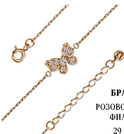
БРАСЛЕТ РОЗОВОЕ ЗОЛОТО, ФИАНИТЫ 29 290 Р