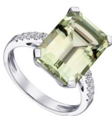
КОЛЬЦО БЕЛОЕ ЗОЛОТО, ПРАЗИОЛИТ, БРИЛЛИАНТЫ 279 250 Р