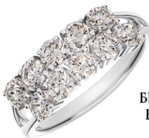
КОЛЬЦО БЕЛОЕ ЗОЛОТО, БРИЛЛИАНТЫ 1 009 200 Р