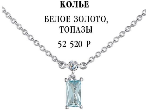
КОЛЬЕ БЕЛОЕ ЗОЛОТО, ТОПАЗЫ 52 520 Р