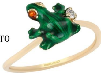
КОЛЬЦО ЖЕЛТОЕ ЗОЛОТО 101 496 Р