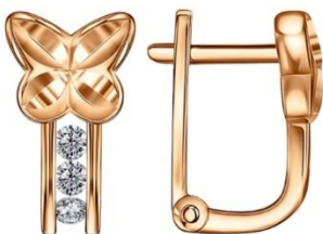
СЕРЬГИ РОЗОВОЕ ЗОЛОТО, ФИАНИТЫ 36 330 Р