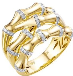
КОЛЬЦО ЖЕЛТОЕ ЗОЛОТО, БРИЛЛИАНТЫ 244 950 Р