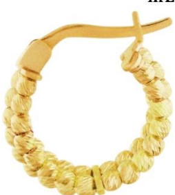
СЕРЬГИ ЖЕЛТОЕ ЗОЛОТО 121 610 Р