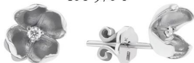
БЕЛОЕ ЗОЛОТО, БРИЛЛИАНТЫ 164 976 Р