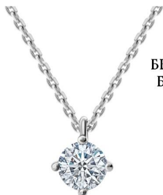
КОЛЬЕ БЕЛОЕ ЗОЛОТО, БРИЛЛИАНТЫ 148 300 Р