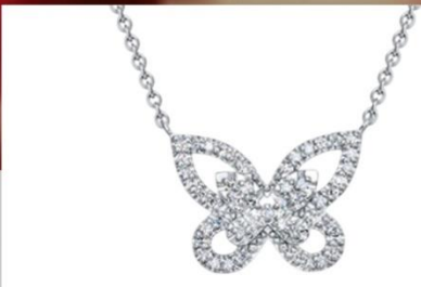
КОЛЬЕ БЕЛОЕ ЗОЛОТО, БРИЛЛИАНТЫ 105 570 Р