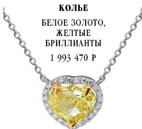
КОЛЬЕ БЕЛОЕ ЗОЛОТО, ЖЕЛТЫЕ БРИЛЛИАНТЫ 1 993 470 Р