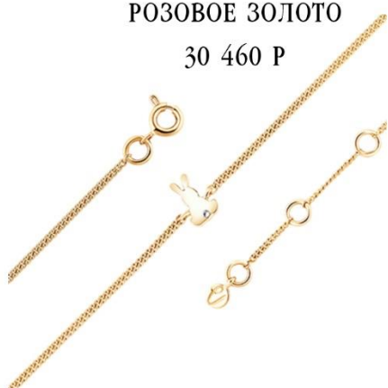
РОЗОВОЕ ЗОЛОТО 30 460 Р