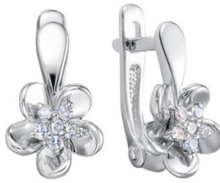
СЕРЬГИ БЕЛОЕ ЗОЛОТО, БРИЛЛИАНТЫ 66 680 Р