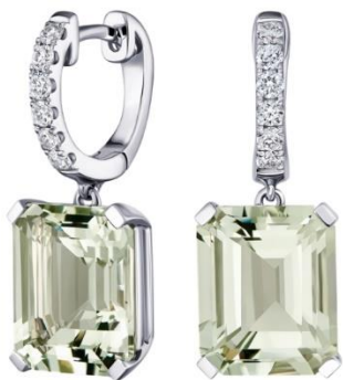
СЕРЬГИ БЕЛОЕ ЗОЛОТО, ПРАЗИОЛИТ, БРИЛЛИАНТЫ 298 550 Р