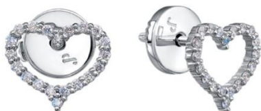
БЕЛОЕ ЗОЛОТО, БРИЛЛИАНТЫ 158 400 Р